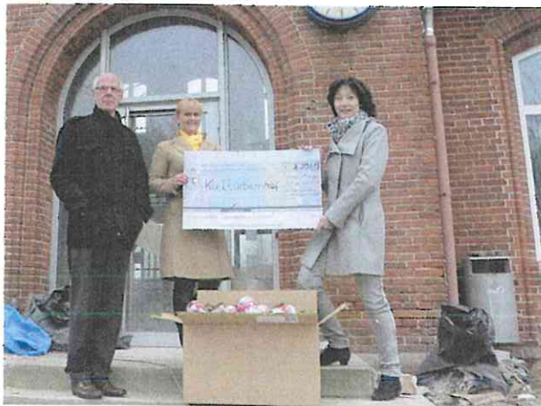
... und noch eine Spendenübergabe