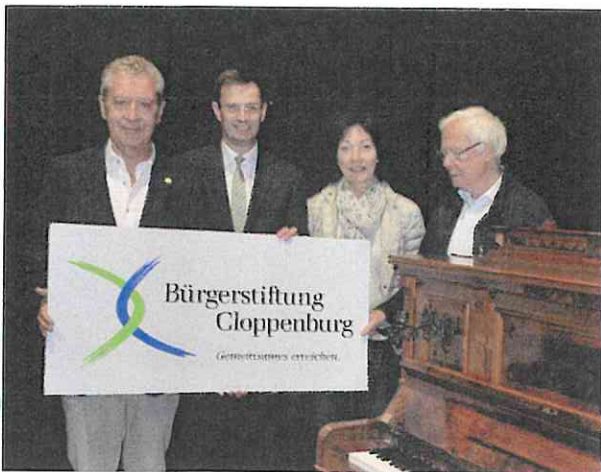
Eine Spendenübergabe ...